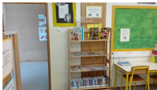
Zona de Leitura Individual