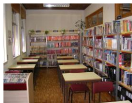
Zona de Leitura Individual