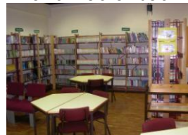
Zona de Leitura Geral